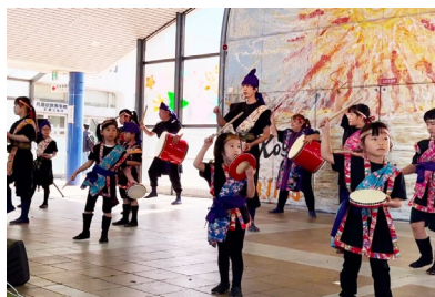
つかぐちまつり演舞