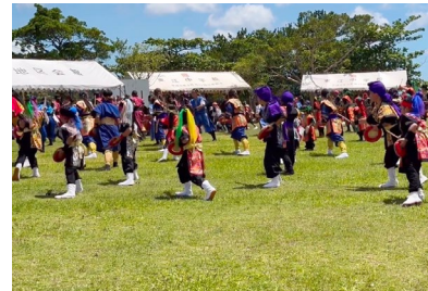
沖縄サガリバナプロジェクト (レキオス主催・世界一斉演舞) 「命どう宝」(名護出演・尼崎中継)